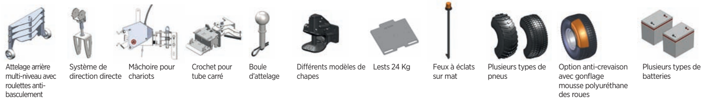
Attelage arrière multi-niveau avec roulettes anti-basculement