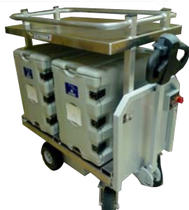
Base d'accueil pour caissons isothermes