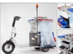
Boite à outils